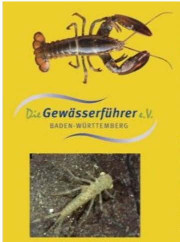
Screenshot Webside Gewässerführer