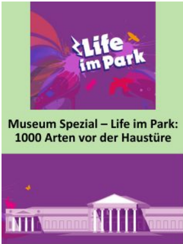
Bild: mit Canva erstellt - Logo von Life im Park Angebot des Naturkundemuseums