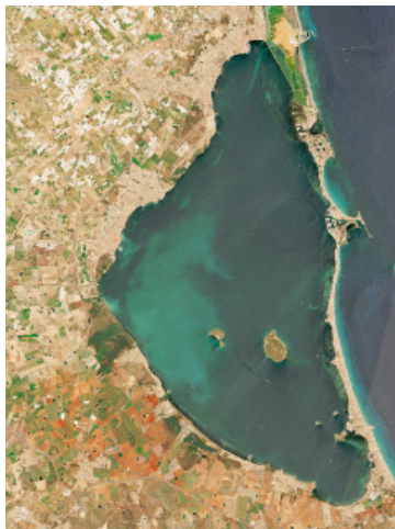
EU Copernicus Sentinel 2026 über Copernicus Browser