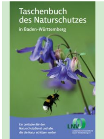
Cover Taschenbuch des Naturschutzes