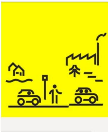
Logo Mitfahren BW Verkehrsministerium