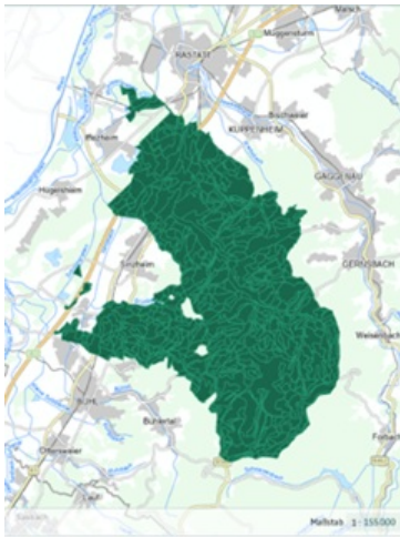
Screenshot LUBW Grundwassererneuerung