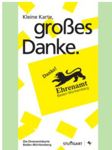
Flyer zur Ehrenamtskarte der Stadt Stuttgart