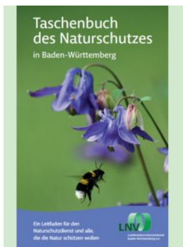
Cover Taschenbuch des Naturschutzes