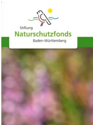
Logo Stiftung Naturschutzfonds