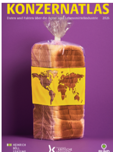
Heinrich Böll Stiftung