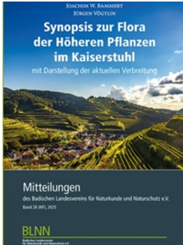
Buchcover Flora des Kaiserstuhls