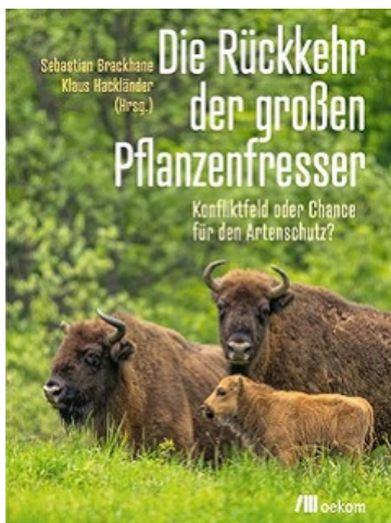
Buchtitel "Die Rückkehr der großen Pflanzenfresser"