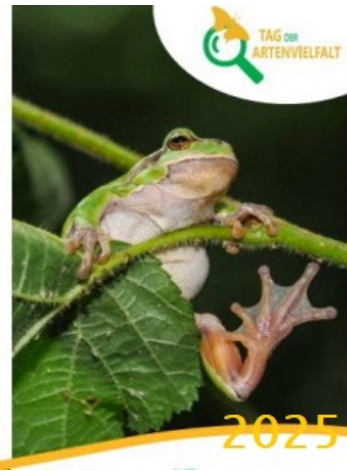
Plakat "Tag der Artenvielfalt"