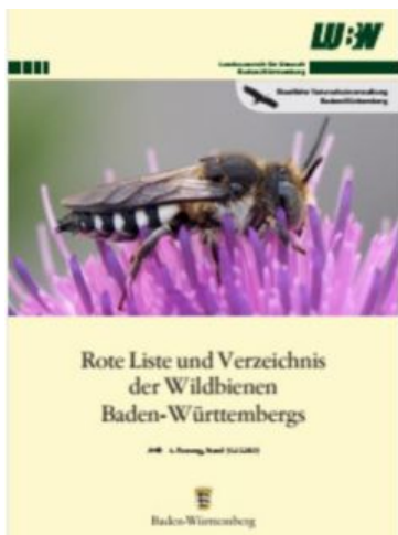
Broschüre "Rote Liste des Wildbienen Baden-Württembergs"