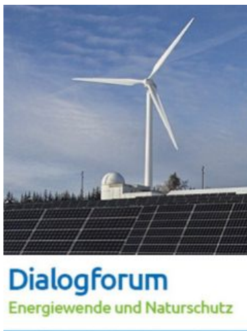
Bild: Logo Dialogforum Energiewende und Naturschutz in Andreas auf Pixabay

Derzeit werden landesweit 26 % der Wege zu Fuß und 11 % mit dem Fahrrad zurückgelegt. Getrennt geführte Radwege und breitere Fußwege tragen laut Verkehrsministerium zur Erhöhung der Verkehrssicherheit bei. Die Förderung dieser kommunalen Rad- und Fußwegen erfolgt über das Landesgemeindefinanzierungsgesetz (LGVFG). Das aktuelle Förderprogramm 2025 bis 2029 (siehe Link) umfasst mehr als 1.000 Maßnahmen mit einem Investitionsvolumen von über einer Mrd. Euro. Das Land BW stellt hierfür insgesamt über 400 Mio. Euro bereit. Tr VM-PM vom 09.04.2025