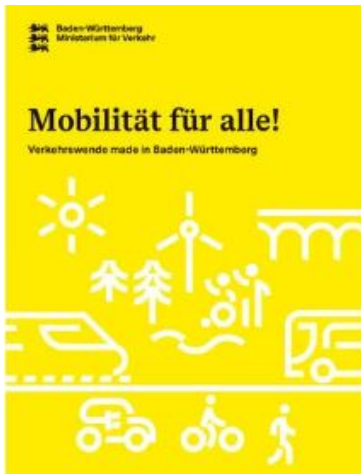
Broschüre "Mobilität für alle"