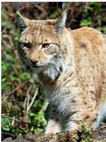
Bild: Luchs Viorel_Zoo Karlsruhe