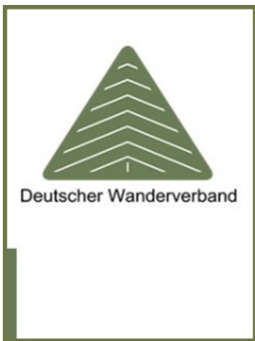
Logo Deutscher Wanderverband