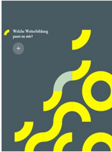
Logo Wissensportal Uni Freiburg